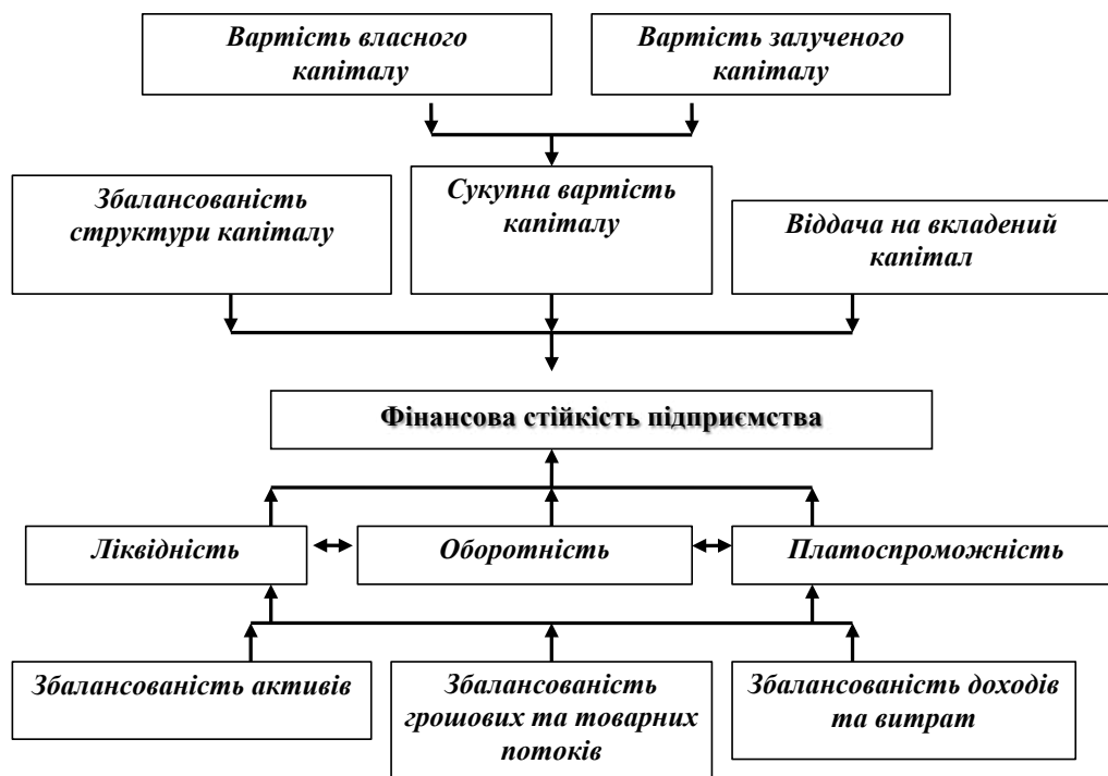
Рис. 4. Фактори формування фінансової стійкості підприємства

Таким чином, можна прийти до висновку, що фінансова стійкість – це наслідок певних процесів (рис.4). Фінансова стійкість як категорія є вторинною по піднесенню до певних категорій.