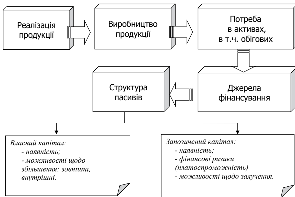
Рис. 2. Причино-наслідковий зв'язок обсягів виробництва → потреби в обігових активах → фінансової стійкості

Як вже зазначалося вище, фінансувати свою діяльність лише за рахунок