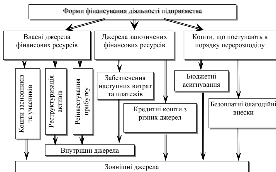
Рис. 1. Форми фінансування діяльності підприємства

Складність питання полягає в тому, що жодне велике чи навіть середнє підприємство не в змозі фінансувати свою діяльність лише за рахунок власних джерел, оскільки потреби в фінансових ресурсах випереджають за обсягами і, саме головне, у часі наявність цих ресурсів. Проблема полягає в тому, що потреба в фінансових ресурсах формується справа → ліворуч (рис. 2), а рух коштів навпаки, т.б. спочатку треба фінансові ресурсу для того щоб закупити сировину, поставити її, виробити продукцію, поставити продукцію покупцю, і тільки після цього отримати від покупця фінансові ресурси. Спочатку платимо, потім отримаємо. Отже процес розірвано в часі і чим триваліший цей процес, тим більше необхідно підприємству коштів для фінансування поточної діяльності (рис. 3). На практиці дуже рідко, щоб підприємство мало лише