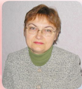
Кандидатка економічних наук, доцентка кафедри Економічної теорії і права