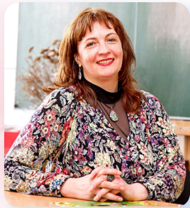
Кандидатка філологічних наук, доцентка кафедри Українознавства, документознавства та інформаційної діяльності