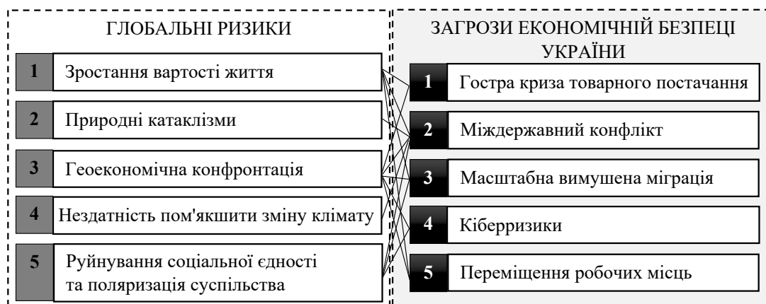
Рис. 1. Взаємозв'язок найбільш небезпечних глобальних ризиків із основними загрозами економічній безпеці України в умовах глобальних перетворень