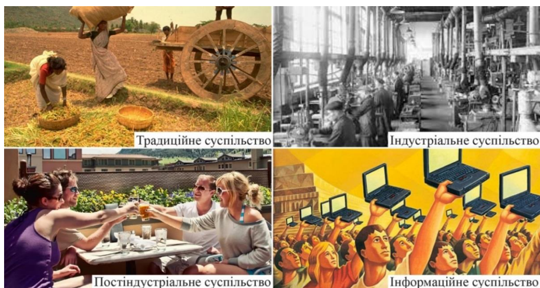
Рис. 4. Типи суспільств

Поява параметричної цифрової архітектури зумовлена її здатністю відповісти на запит суспільства у несенні деякого сенсу. Іншими словами, сучасні архітектурні форми виникли тому, що їх значення перетинається із цінностями сучасного суспільства. Суспільні цінності різняться залежно від типу нашого суспільства та характерних для нього рис (рис. 4).