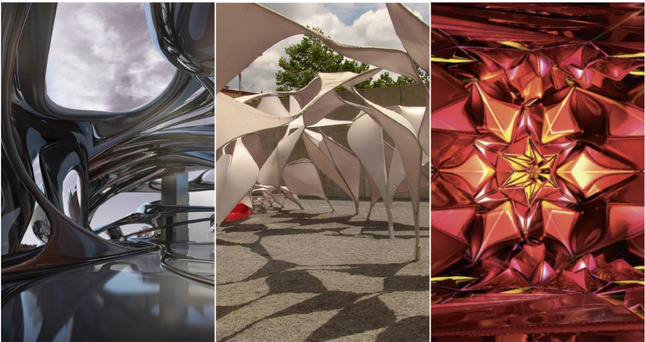
Рис. 1. Приклади сучасних архітектурних форм

Аналіз публікацій. Розкрили сутність поняття «форма в архітектурі» у роботах І. А. Добрицина, Ю. І. Курбатов, О. Г. Рапппорт, Г. Ю. Сомов. Проблеми інформатизації відобразили: І. В. Бірілло, Г. В. Лаврентьєв. Дослідження, що застосовують досягнення наук складності в архітектурі, проводили: К. Александер, П. М. Аллен, Е. Аркаут, А. Басірі, Л. Беттанкур, М. Бетті, Д. Брін, Т. Вайєлд, Дж. Вест, Ф. Классенс, М. К. Компанелла, П. Лонглі, Е. Менлі, Дж. Португалі, Г. Саймон, Н. А. Салінгарос, Т. Стонон, К. Ратті, Д. Фрезер, М. Фот, Б. Хільєр. Розкривають загальний понятійний зміст теоретичних та методологічних проблем архітектури такі автори як В. А. Абизов, М. Г. Бархін, М. В. Бевз, Я. Гейл, В. Л. Глазичев, Дж. Джейкобс, М. М. Дьомін, В. Й. Кравець, О. В. Крашенінніков, К. Лінч, А. П. Мардер, Г. Б. Мінервін, В. П. Мироненко, З. В. Мойсеєнко, В. А. Нікітін, А. М. Рудницький, О. В. Рябушин, І. І. Середюк, І. М. Смоляр, О. Л. Титов, О. О. Фоменко, Б. С. Черкес, М. Черноушек, О. В. Шило, В. Т. Шимко, Ю. М. Шкодовський, З. М. Яргіна.