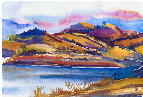
Кіпр. Захід сонця

Запрошуємо читачів на своєрідну художню галерею, яку відриває доцентка кафедри архітектурного проектування та містобудування, архітектор, ландшафтний дизайнер, художник та ілюстратор Євгенія Самойленко : «Моїм натхненником є міське життя, краєвид, абстракція, природа. Основні сфери інтересів включають ландшафтну архітектуру, дизайн візерунків, розпис стін, ілюстрацію».