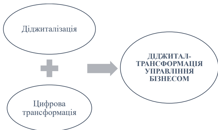
Рис. 1. Схематичне відображення логічної послідовності етапів діджитал-трансформації бізнес-процесів

Враховуючи вищевикладені аспекти нагальною є необхідність розуміння керівництвом компаній комплексної системи пристосування та адаптації управлінських рішень до сучасних цифрових технологій із використанням можливостей хмарних технологій, новітніх цифрових адаптерів та систем. Комплексний підхід до визначення теоретичних аспектів розвитку цифрових трансформацій формує цифрову стратегію компанії. У світі