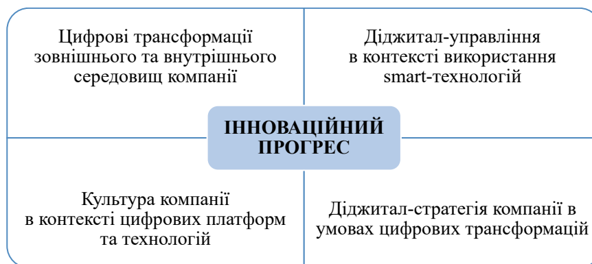
Рис. 2. Напрями інноваційного розвитку бізнесу компаній в умовах цифрових трансформацій