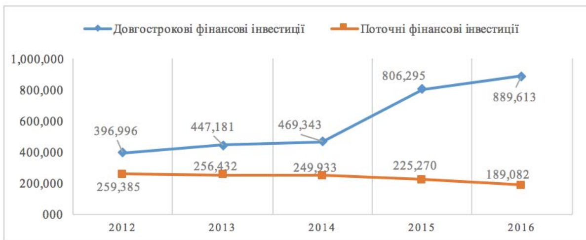
Рис. 1. Динаміка фінансових інвестицій підприємств України за 2012-2016 рр, млн. грн Джерело : складено автором за офіційними даними [7]

Викладення основного матеріалу дослідження. Дослідження статистичних даних щодо розміру фінансових інвестицій підприємств в Україні (рис.1) дозволяє визначити їх позитивну динаміку зростання та зміну їх структури у бік збільшення частки довгострокових фінансових інвестицій. Це свідчить про те, що підприємства України все частіше використовують шлях диверсифікації комерційних ризиків діяльності через участь у капіталі інших підприємств, що актуалізує наукові дослідження у сфері оцінки доцільності здійснення фінансових інвестицій підприємствами.