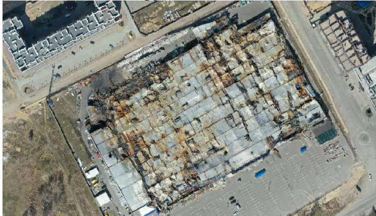
Рис. 2. Зйомка зі супутника зруйнованого даху ТЦ ЕПЦЕНТР

Відеозйомка із супутника (рис. 2) дала змогу простежити й інші технічні пошкодження, такі як розтрощені вікна, розірвані стіни, руйнування фасаду тощо. У цілому будівля ЕПЦЕНТР після атаки втратила свою структурну цілісність та перебуває в аварійному стані, потребує ліквідації наслідків та ремонтних робіт для відновлення функційності та безпеки.