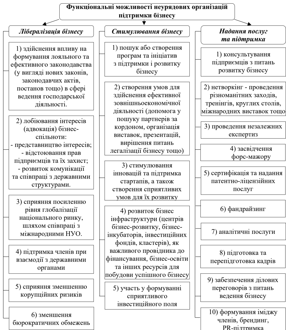
Рис. 5. Функціональні можливості неурядових організацій підтримки бізнесу