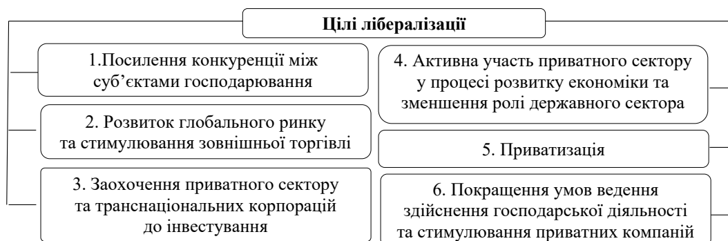
Рис. 2. Основні цілі лібералізації