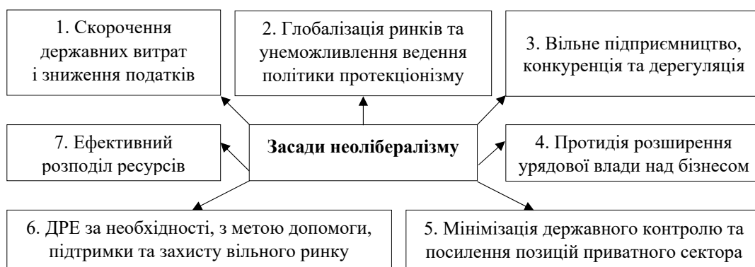
Рис. 1. Засади неолібералізму

Економічна лібералізація часто асоціюється з приватизацією, яка є процесом передачі власності, державного майна від державного сектора до приватного. ЄС лібералізував ринки газу та електроенергії, запровадивши таким чином відповідну конкурентну систему [9].