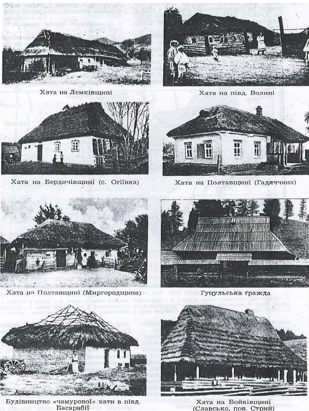
Рис. 2. Типи українських хат за місцем розташування

Житлову частину і сіни обмазували глиною та білили крейдою. До речі, цей звичай мазати і білити хати в Україні дуже давній, йде корінням в епоху Трипілля.