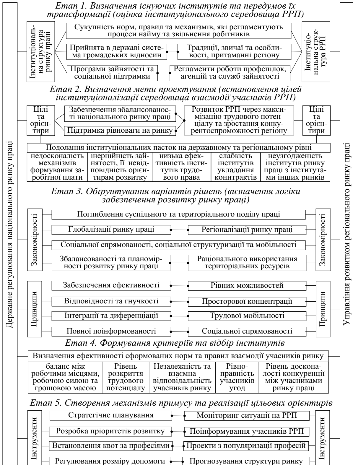
Рис. 1. Співвіднесення етапів організації управління розвитком регіонального ринку праці зі структуризацією предметної області дослідження Розроблено автором

будуть зовсім іншими. При цьому, у будь-якому випадку передбачається наступність означених на рис. 1 елементів в частині додержання ієрархічності будь-якої економічної системи.