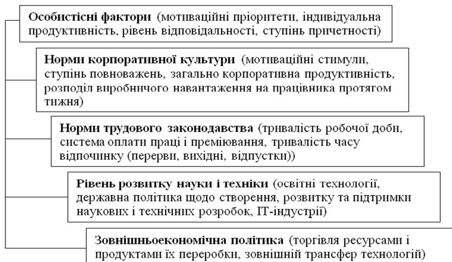
Рис. 3. Ієрархія факторів зростання ВВП