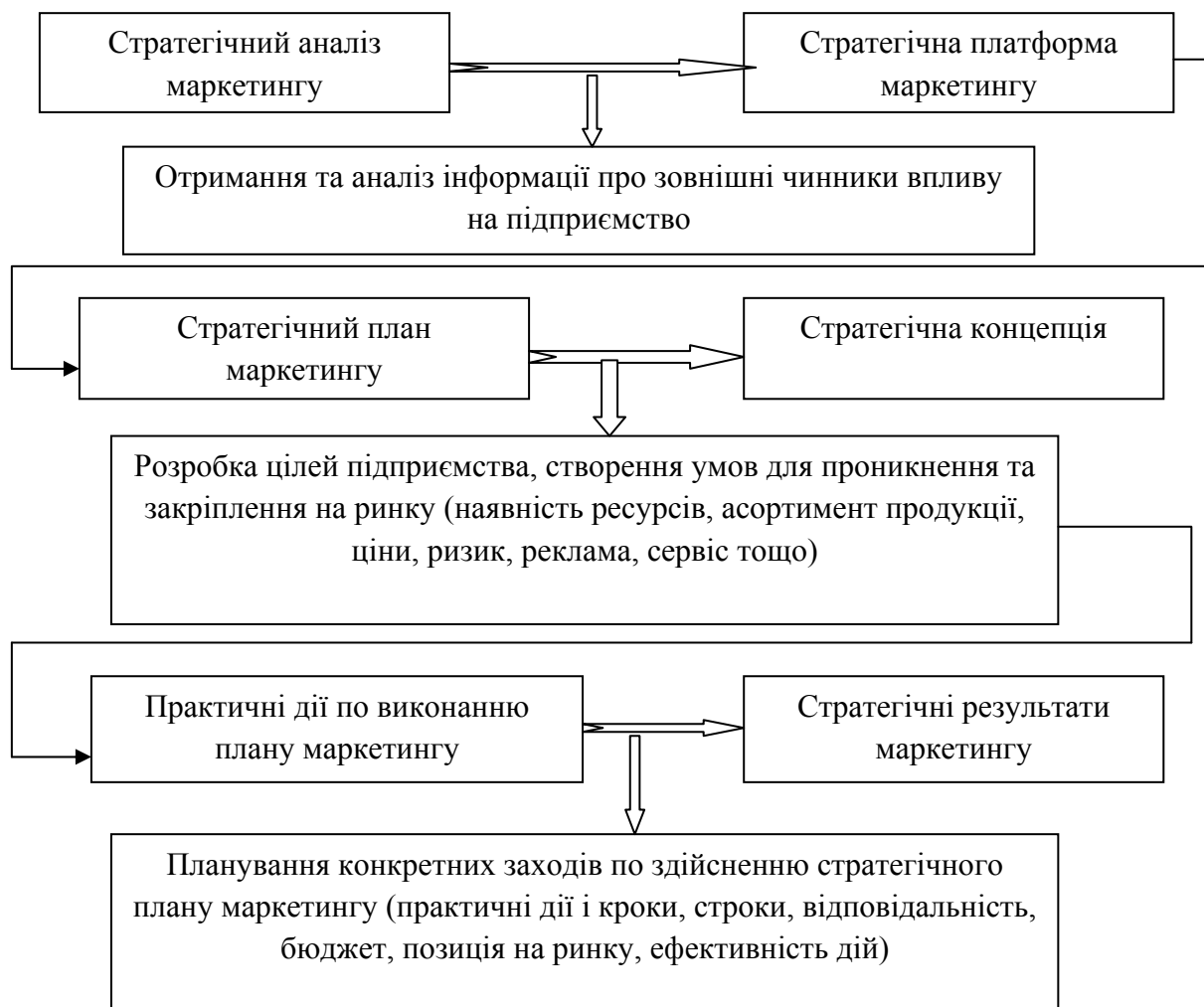
Рис. 2. Послідовність етапів стратегічного планування маркетингу

Деякі підприємства завдяки стратегічному маркетингу мають значну конкурентну перевагу перед суперниками. Їх стратегічний маркетинг включає: справжнє розуміння потреб замовника, забезпечення творчої, професійної презентації продукції. Нижче перераховані деякі з основних маркетингових стратегій, використовуваних провідними підприємствами, щоб переконатися, що вони випереджають конкурентів в області маркетингу, розміщення, бренду і лояльності.