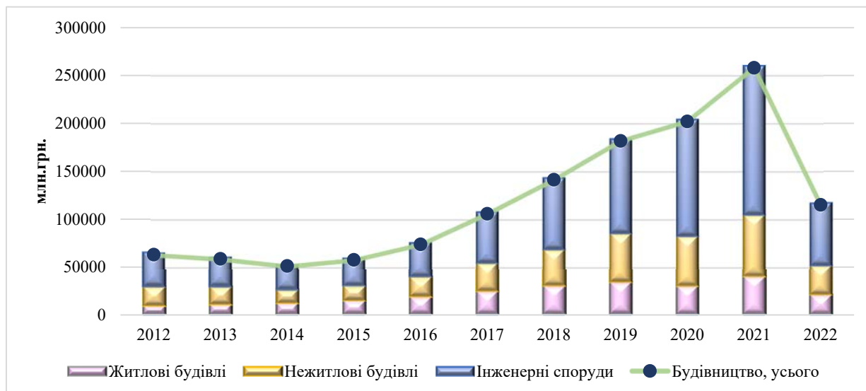
Рис. 1. Динаміка будівництва за 2012–2022 роки

Джерело: розроблено авторами на основі [2]