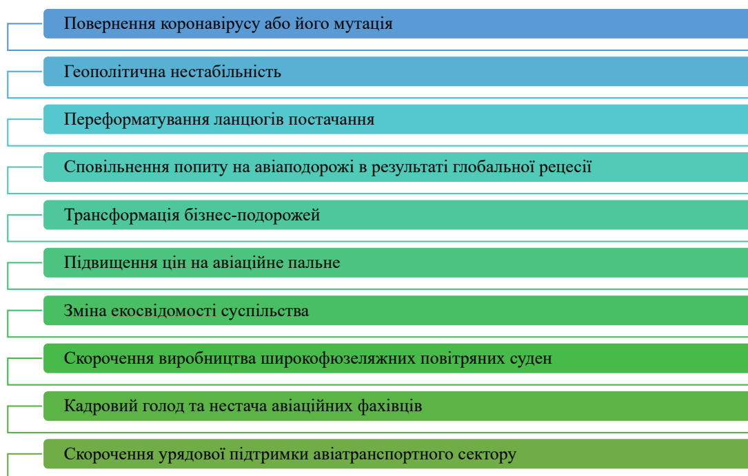
Рис. 3. Ключові ризики та загрози світовому ринку авіаційних перевезень

Дефіцит важливих авіаційних вузлів і запчастин, елементів електроніки в сукупності з глобальними логістичними проблемами призводить до того, що терміни виконання деяких робіт і виготовлення компонентів збільшуються, у деяких випадках на понад року, що змушує авіакомпанії та авіаремонтні заводи переформатувати свої стратегії ланцюгів постачання [39]. Крім того, економічний спад призвів до банкрутства низки постачальників авіаційних двигунів, їх переорієнтацію на виробництво компонентів для інших секто-