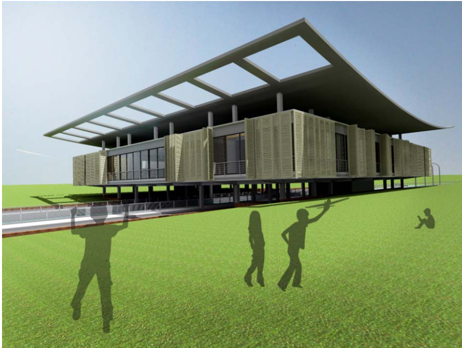
Рис.1. Загальний вигляд сучасної школи для обдарованих дітей

Виклад матеріалу. Даний проект розроблено із застосуванням сучасних енергозберігальних технологій будівництва. Завдяки цим технологіям зекономлені кошти можна спрямувати на надання поглибленого сучасного курсу навчання, в матеріально технічну базу та на створення інтелектуального архітектурного середовища (рис. 1, 2). Розташування будівлі в приміській зоні сприяє зменшенню техногенного впливу міста. Передбачена кількість учнів становить 300 осіб.