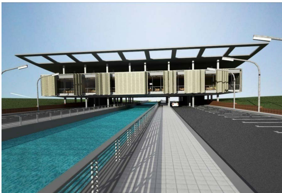
Рис. 2. Загальний вигляд сучасної школи для обдарованих дітей