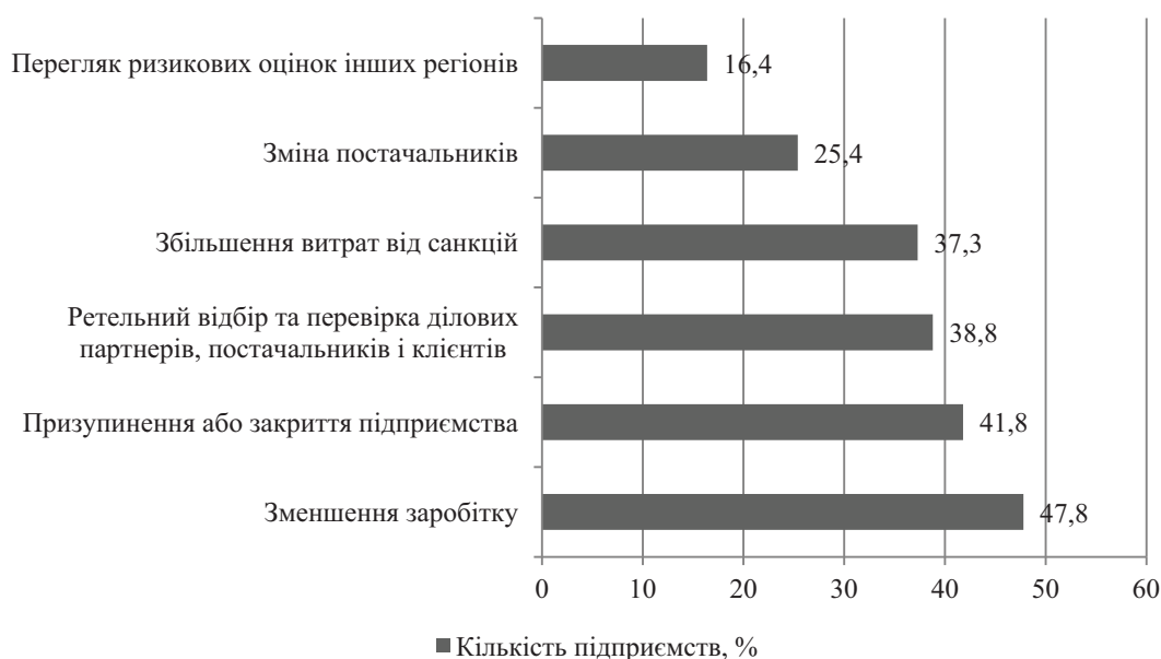
Рис. 2. Вплив війни в Україні на японські компанії, %

Проводячи паралель із вітчизняними підприємствами, можемо побачити, що протягом останніх років, особливо в період пандемії та повномасштабної війни держава намагалась всіма доступними методами підтримати бізнес. Серед найбільш дієвих механізмів підтримки підприємств виділяють податкові послаблення у вигляді скасування штрафних санкцій, надання звільнення від сплати ряду податків,