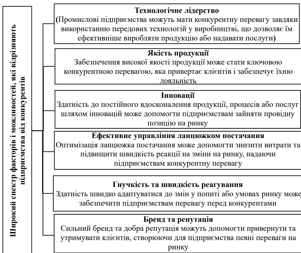
Рис. 1. Загальний перелік переваг, які можуть допомогти вітчизняним промисловим підприємствам забезпечити стійку конкурентоспроможність