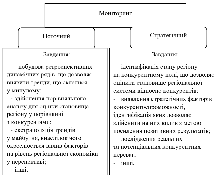
Рис. 1. Напрями моніторингу та їх завдання

Моніторинг поточного стану базується на широкому спектрі індикаторів, серед яких доцільно обрати найбільш інформаційні. Так, оцінка рівня людського