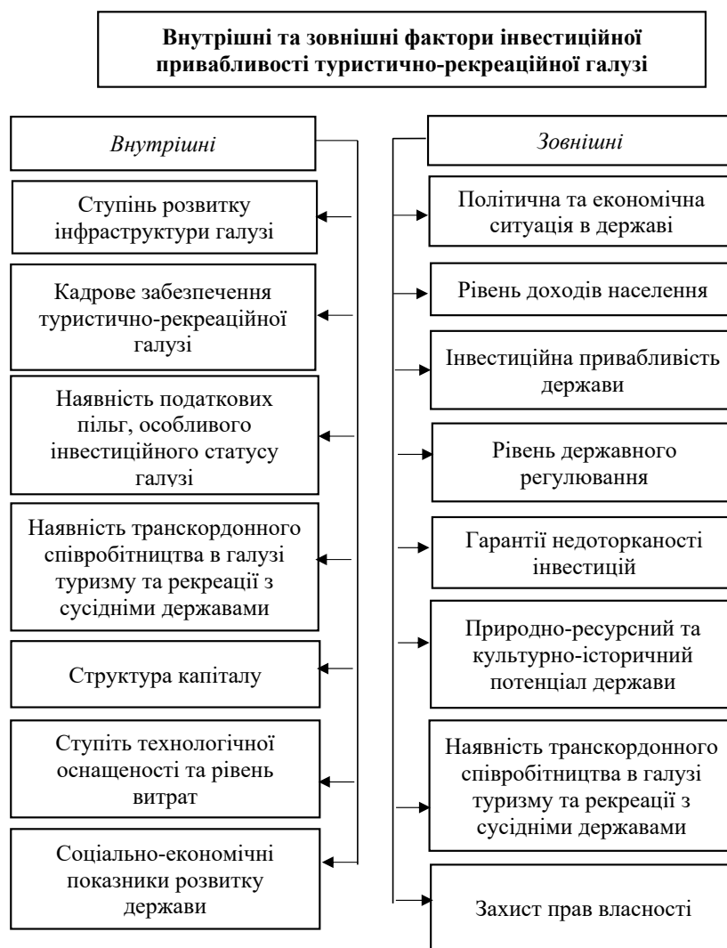
Рис. 2. Внутрішні та зовнішні фактори інвестиційної привабливості туристично-рекреаційної галузі