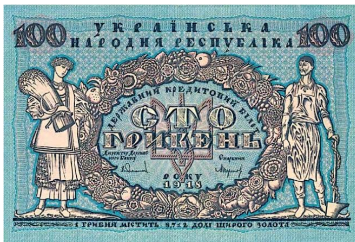
Рис. 1. «100 гривень»

Нарбут був першою людиною після Володимира Великого та Ярослава Мудрого, хто зобразив тризуб на українських грошах. Він автор 13 з 24 банкнот, випущених за часів української державності у 1917–1920 роках.