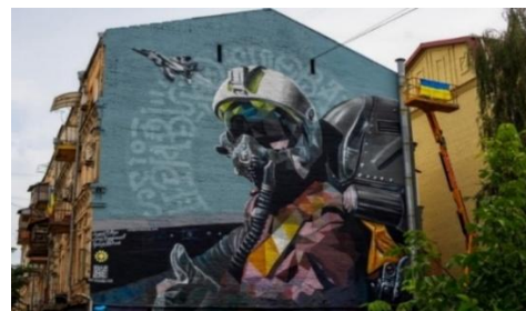
Рис. 8. Арт-об'єкт : мурал «Привид Києва» на Подолі (мезорівень)

За дослідженнями О. В. Харлана, від початку повномасштабного вторгнення (на період виходу статті) зафіксовано інформацію про 530 епізодів воєнних злочинів росії проти української культурної спадщини [12].