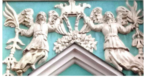
Рис. 3. Липнина дзвіниці Софії Київської (мікрорівень)

розкривають світогляд українського народу та його багатотисячлітню історію (рис. 3).