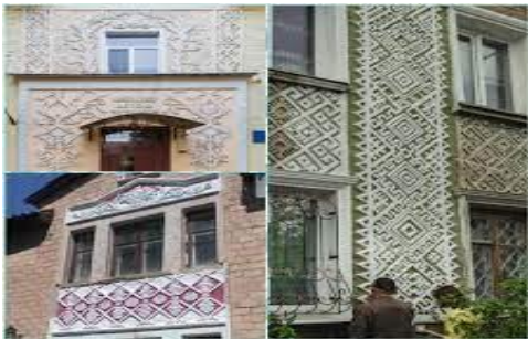
Рис. 6. Кам'яні вишиванки (мікрорівень)

Застосування однакових символів у різних об'єктах архітектурного середовища дає можливість об'єднати різні елементи в єдиний комплекс, а також створити загальну концепцію архітектурного середовища.