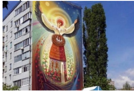
Рис. 7. Образ «Берегині» на фасаді сучасної багатоповерхівки (мезорівень)

американський письменник та сценарист Дейв Еггерс.