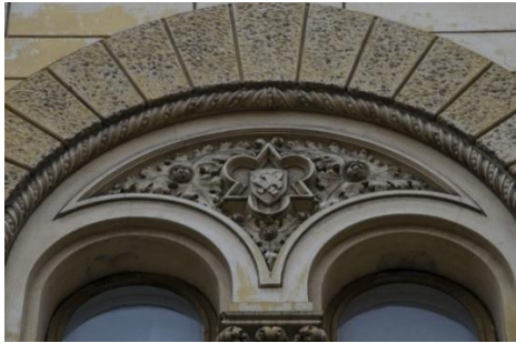
Рис. 5. Масонські символи в архітектурі Одеси (мікрорівень)