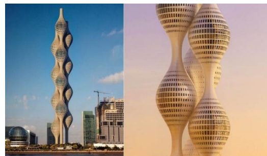
Рис. 2. Сплетені бапти Ternary Tower у Kuma як символ нескінченності (макрорівень)

Об'єкти культурної спадщини сучасної України також стали багатим джерелом інформації про події, культуру та світогляд українського народу. Вони відбивають вплив різних культур та епох, а також несуть у собі глибинний символічний зміст.