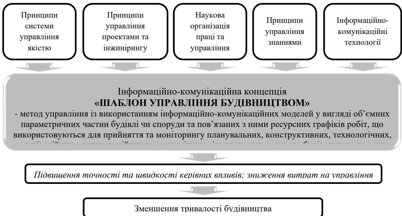
Рис. 1. Ефективність інформаційно-комунікаційної концепції «шаблон управління будівництвом» [24]

гіпотези зроблене наступне припущення. Для ліквідації невизначеності організаційного середовища відбудови від наслідків військової агресії потрібна суттєво нова бізнес-модель, що об'єднувала б принципи системи управління якістю, управління проектами, наукової організації праці та управління в будівництві і можливості сучасних інформаційно-комунікаційних технологій. Такою бізнес-моделлю може стати метод управління будівельним виробництвом із застосуванням нової інформаційно-комунікаційної концепції «шаблон управління будівництвом» (рис. 1).