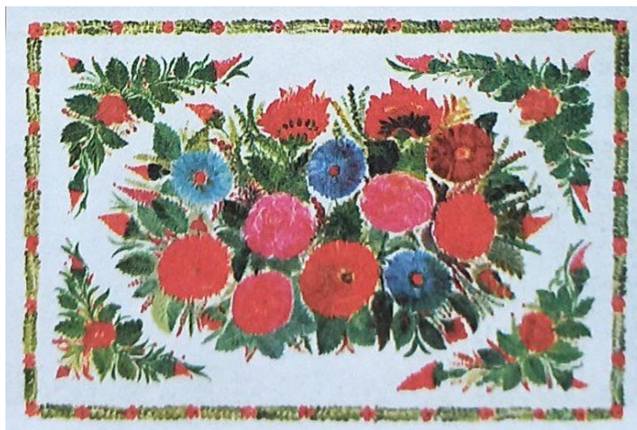
Рис. 1. Т. Пата. Килимок. 1968 р.

У петриківському розписі для зображення предметів або рослин, тварин, використовується узагальнення, спрощення їх форм, відокремлювання найвиразніших рис кольором та лініями, тобто такий процес, як стилізація. Петриківські майстри не намагаються, так би мовити, зобразити ботанічну схожість кожної квітки чи птаха. Їхня мета – саме у стилізованому вигляді передати власне бачення світу і почуттів, втілюючи їх у мальовничих візерунках.