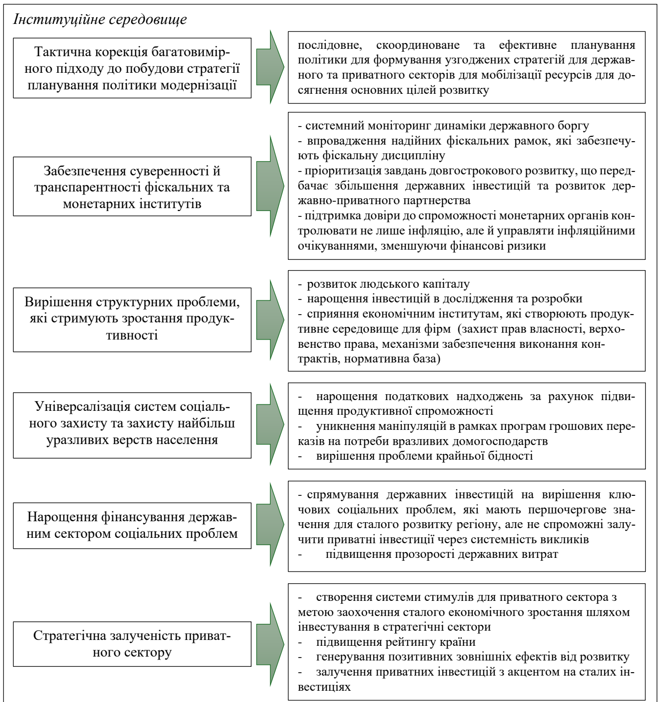
Рис. 1. Інституційні стовпи політики модернізації у країнах ЛАК в умовах загострення соціально-економічних викликів Джерело: укладено авторами

модернізації у пріоритетних секторах [30]. Ресурсне прокляття в ЛАК ( багаті природні ресурси VS структурні асиметрії та нерівність ), вразливість до зміни клімату та необхідність нарощення інвестицій в проєкти із адаптації до наслідків глобального потепління, сукупність соціально-економічних потрясінь ( валютних, фінансових, боргових тощо ) загрожують подальшому загостренню структурних соціальних, економічних та екологічних викликів у регіоні, а відтак вимагають стратегічних політичних дій (рис. 1).