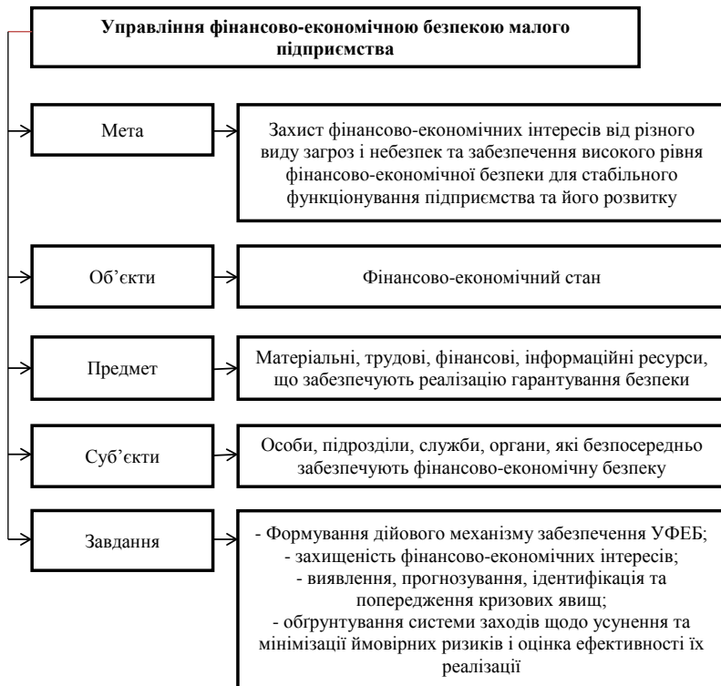
Рис. 3. Узагальнені складники управління фінансово-економічною безпекою підприємства

– управлінської – система принципів і методів розробки та реалізації управлінських рішень, пов'язаних із досягненням його фінансової стій-