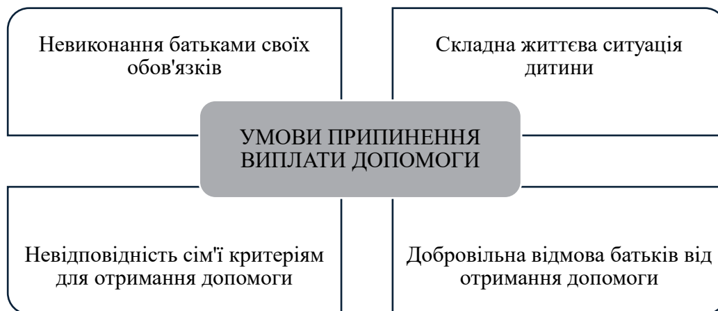
Рис. 1. Основні умови припинення виплати допомоги багатодітним сім'ям