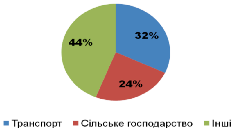
Рис. 2 Структура лізингового портфелю України в розрізі галузей економіки, станом на 31.12.2017

Структуру лізингового портфелю України в розрізі галузей економіки, станом на 31.12.2017 подано на рисунку 2. Із рисунку 3, на якому показано динаміку портфелю лізингових договорів лізингодавців небанківської сфери України, видно, що протягом останніх трьох років не відбулось значного покращення на ринку лізингу.