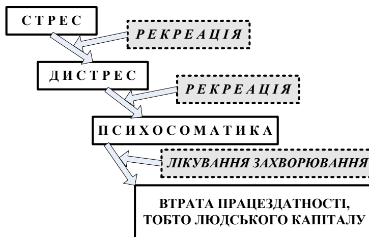
Рис. 2 Місце необхідних процесів рекреації в життєдіяльності людини

Таким чином, здійснені у ХАТМК дослідження кроунограм людей до та після перегляду спектаклів виявили невідоме раніше явище – «здібності» театру «загоювати» енергоінформаційні оболонки («аури») глядачів. Це відкриття підштовхнуло до висновку про ще одну (і може найважливішу) функцію театру – рекреаційну, завдяки чому людина після праці має можливість відпочити і відтворити свій так званий людський капітал [12]. При порушенні цього правила людину чекає ланцюжок подій та станів, який наведено на рис. 2.