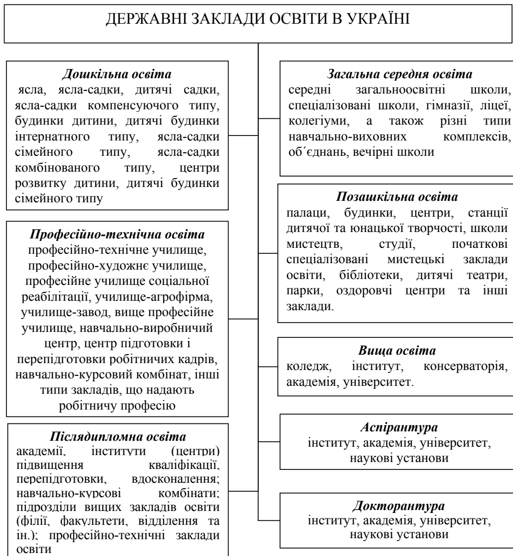
Рис. 1. Структура системи державних закладів освіти в Україні

На вітчизняному ринку програмного забезпечення для управління персоналом пропонується багато програм різних виробників: «1С», «ПАРУС-Підприємство», «Галактика»,