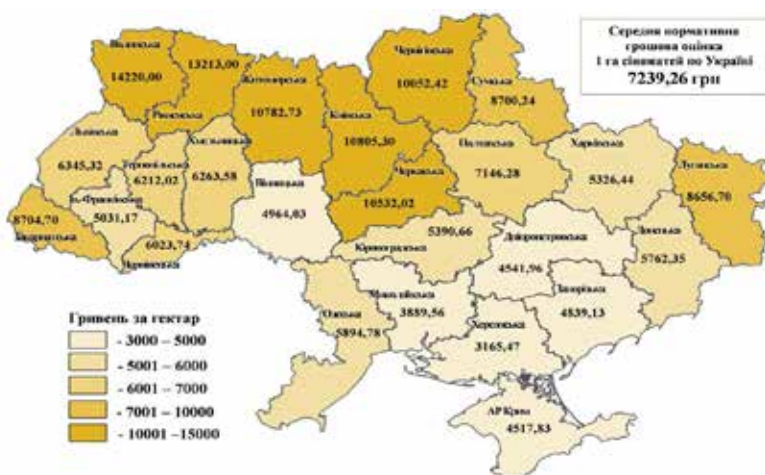
Рис. 2. Нормативна грошова оцінка 1 га природних сіножатей станом на 01.01.2017