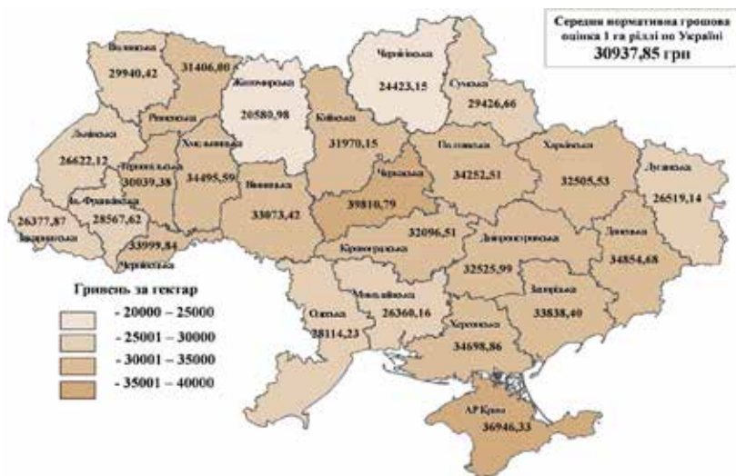
Рис. 1. Нормативна грошова оцінка 1 га рілля та перелогів станом на 01.01.2017

Центром розвитку громади є культурно-духовний її осередок, наприклад школа, яка є енергоєфективною, функціональною та такою, що значною мірою себе забезпечує, зокрема продовольством власного виробництва, головним чином, овочами та фруктами, вирощеними вчителями, дітьми,