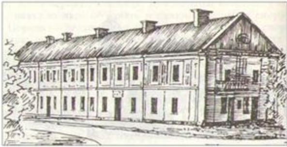
Монастир домініканців у Луцьку (XVIII ст.)

Залежно від своєї першочергової функції монастирі в Луцьку мають таке розташування: