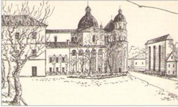
Монастир єзуїтів у Луцьку (XVII ст.)

в її керівництві населенням, монастирі з оборонними функціями в системі міста та монастирі інших чернечих орденів, що не мали пріоритетного впливу на суспільство в той чи інший період функціонування.