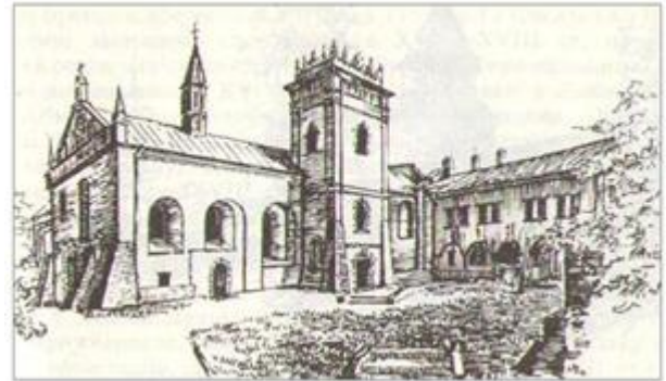
Монастир бернардинців у Луцьку (XVIII-XIX ст.)

Монастирі, розташовані в центральній частині старовинної забудови Луцька: