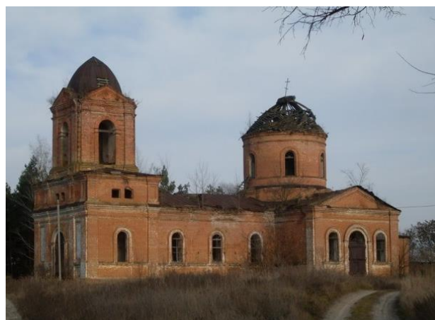
Рис. 1 – Вид с юго-западной стороны на храм Димитрия Солунского в с. Бышкинь (Лебединский район, Сумская обл.)

Изложение материала. Поскольку одним из наиболее распространенных архитектурно-планировочных решений храмов является крестово-купольный, то для достижения поставленной цели выбран объект данного типа: православный каменный храм святого великомученика Димитрия Солунского (с. Бышкинь, Лебединский район, Сумская обл.) (рис. 1).