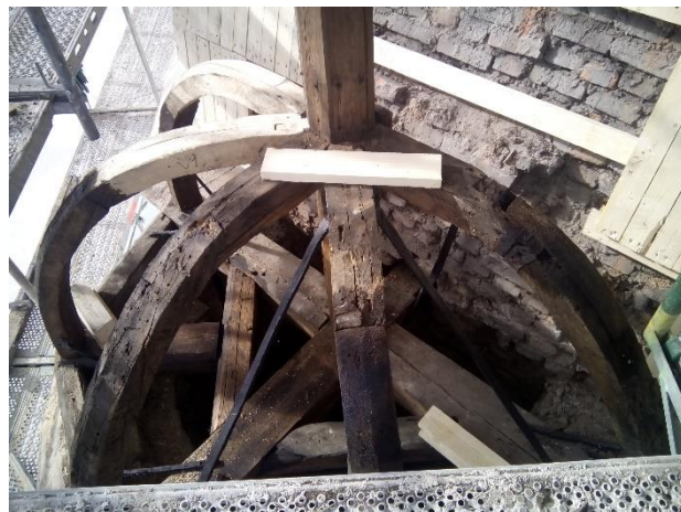
Рис. 3 – Пример протезирования конструкций главки в храме Пресвятой Богородицы (г. Тарту, Эстонская Республика)

Устройство кровли над основным объемом храма. В случае частичной непригодности несущих конструкций кровли допускается выполнение протезирования (замены поврежденных участков на новые элементы) (рис. 3). В целом состав выполняемых работ и технология их производства мало чем отличается от возведения обычной двускатной кровли по деревянным несущим конструкциям.