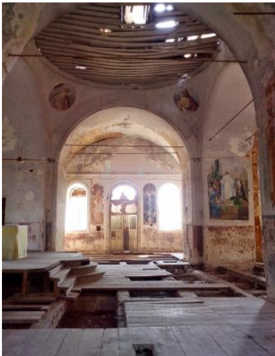
Рис. 2 - Вид внутри храма Дмитрия Солунского в с. Бышкинь с северного предела

плуатации. Это обусловлено такими показателями как эрозия кладки стен основного объема здания, барабана, колокольни (местами зафиксированы участки с вывалами отдельных кирпичей), аварийное состояние конструкций покрытия, в том числе над средокрестьем и колокольней. В храме частично отсутствует напольное покрытие (рис. 2). Помимо прочего, требуется проведение ремонтно-реставрационных работ по восстановлению внутреннего убранства - интерьера и росписей.