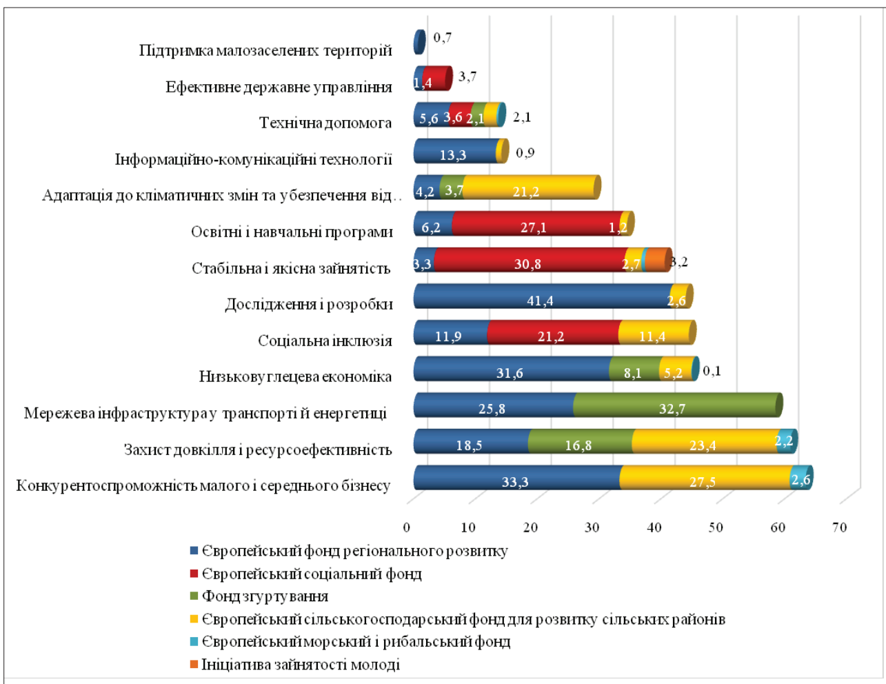
Рис. 1. Цільовий розподіл фінансування пріоритетних напрямів реалізації інтеграційної стратегії ЄС у розрізі Європейських структурних й інвестиційних фондів на період 2014–2020 рр., млрд. євро [9]