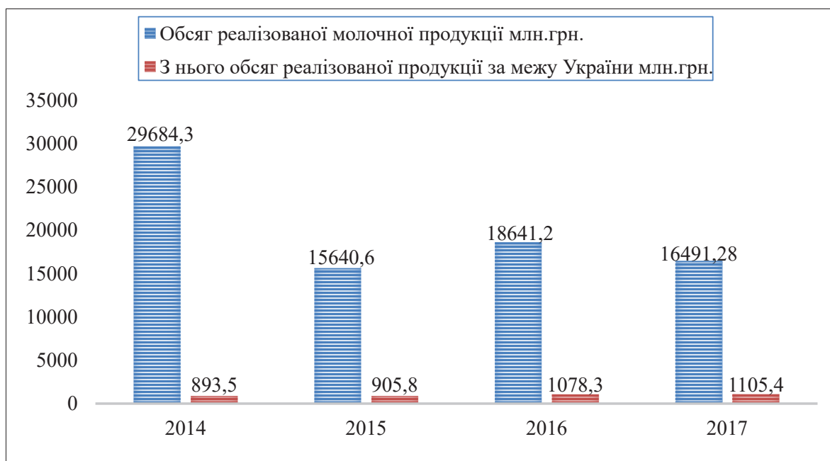
Рис. 2. Динаміка обсягу реалізованої молочної продукції за 2014–2017 рр., млн. грн.