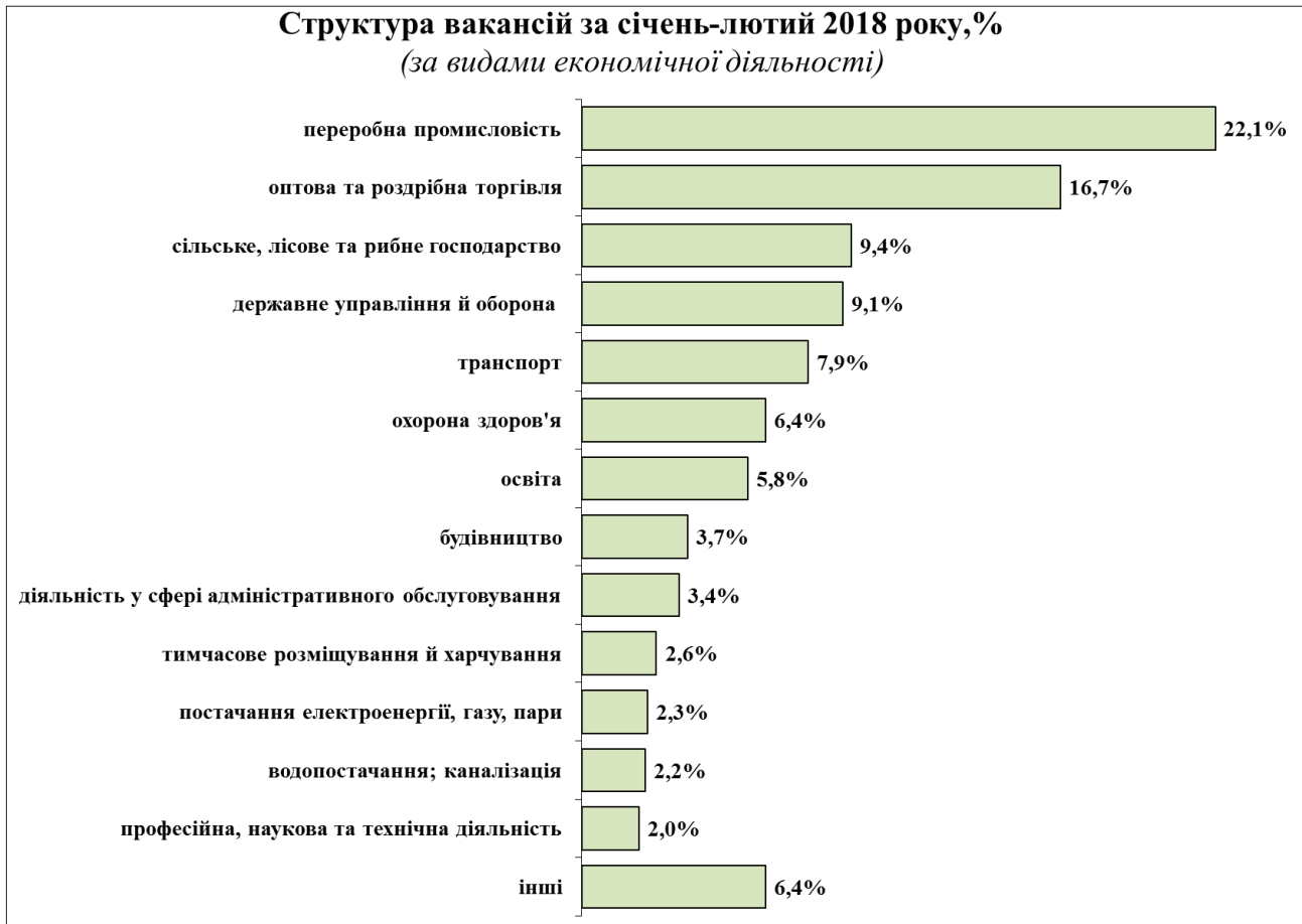
Рис. 1. Структура вакансій за січень-лютий 2018 року

та установах переробної промисловості, 17% – в оптовій та роздрібній торгівлі, по 9% – у державному управлінні й обороні та у сільському господарстві, 8% – у транспорті, 6% – в охороні здоров'я (рис. 1) [9].