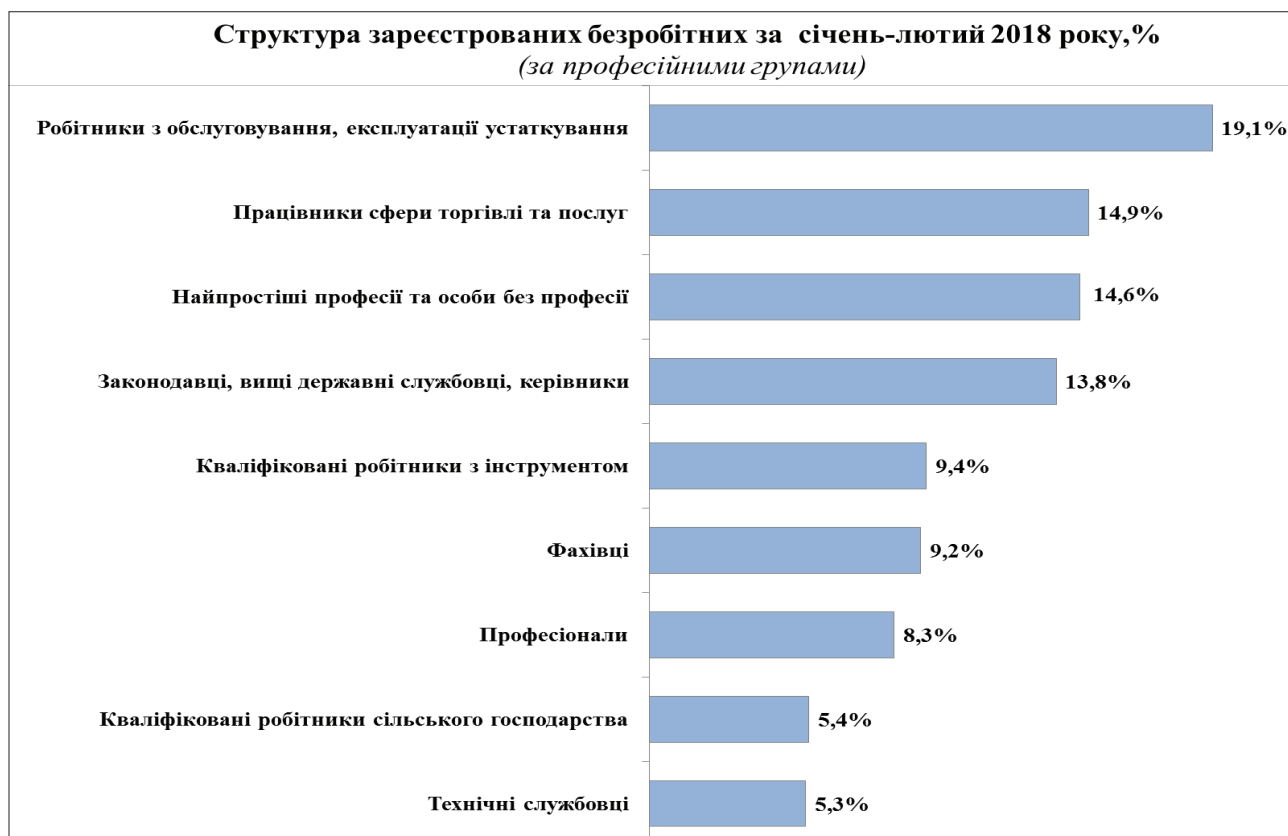
Рис. 3. Структура зареєстрованих безробітних за січень-лютий 2018 року