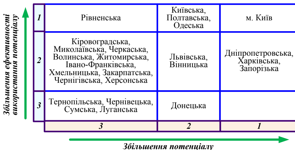
Рис. 3. Матриця «Потенціал регіону – Ефективність використання потенціалу регіону»

Мета промислової політики держави та інструменти їх реалізації, повинні бути розподіленими та чітко визначеними за рівнями управління. Тому, регіональна політика повинна відповідати цілям і завданням держави. До основних стратегічних завдань регіонального розвитку можна віднести: модернізація інфраструктури регіонів, поліпшення рівня економічного стану за рахунок впровадження заходів з підвищення ефективності використання потенціалу; усунення диспропорцій у соціально-економічному становищі регіонів; формування територіально-виробничих комплексів і промислових вузлів за основними логістичними напрямками; стимулю-