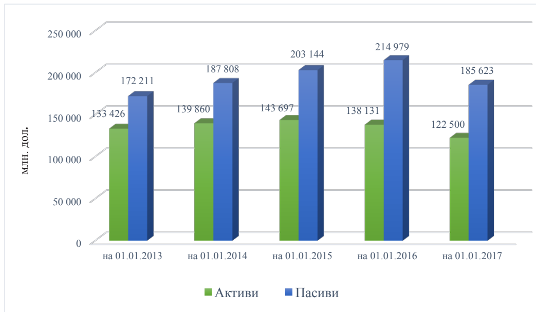
Рис. 3. Динаміка міжнародної інвестиційної позиції України