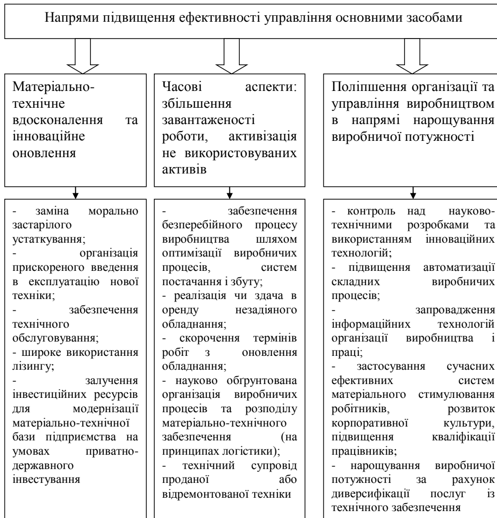
Рис. 3. Класифікація чинників, що впливають на ступінь використання виробничої потужності підприємства