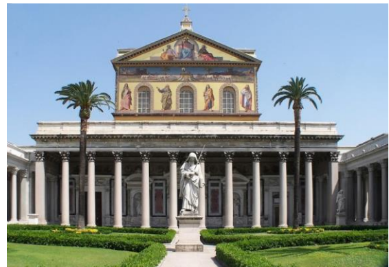
Рис. 1. Собор Св. Павла в Римі «поза муром»

Нове місце побудови міста Катеринослав на цей раз було обрано особисто Потьомкіним та провідними тогочасними архітекторами Росії. Планувалося, що кращим місцем буде великий пагорб на зломі ріки (сучасний Нагірний масив). Із документів, що збереглися до наших часів, видно, з яким розмахом планувалося будівництво. За проектом Потьомкіна головна і краща частина міста була запропонована на Соборній горі. Тоді це місце було абсолютно голим, покрите травою, бур'яном та чагарником. Найближчі будівлі – глиняні хати слободи Половиця, під горою біля Дніпра, в районі нинішніх вулиць Колодязна, Ливарна, Кам'яниста, Барикадна. У той час там налічувалося близько 100 мазаних будівель. До найближчого адміністративного центру – Кременчука кінями треба було їхати принаймні кілька днів.