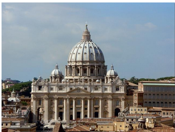
Рис. 2. Собор Св. Петра в Римі

життя півдня Росії. Катеринославу відводилася особлива роль, його передбачалося перетворити на «третю південну столицю Російської імперії».