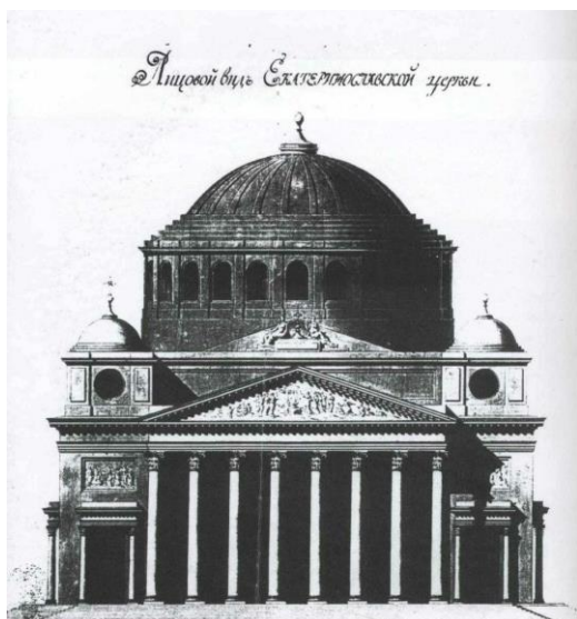
Рис.3. Початковий нереалізований проект Преображенського собору К. Геруа

Вдалих вибір нового майданчика під будівництво міста остаточно затвердив Потьомкін у своїх намірах. Ось що він пише Катерині II у своїх проектних міркуваннях щодо майбутнього міста: «Центр строительства на горе – Собор – внутри подражание собору Св. Павла в Риме ( Basilica di San Paolo fuori le Mura , див. рис. 1), а снаружи подражание собору Св. Петра в Риме ( Basilica di San Pietro , див. рис. 2), храм великолепный, посвященный Преображению Господнему, в знак того, что страна сия из стезей бесплодных преобразена в вертоград обильный и обиталище зверей – в благоприятное пристанище людей из всех