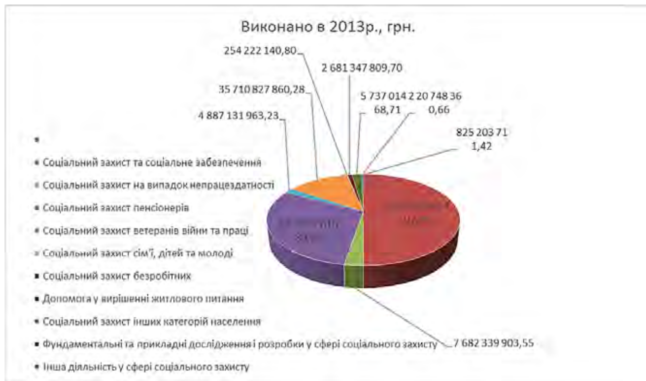
Рис. 1. Показники виконання бюджету у сфері соціального захисту у 2013 році [3]