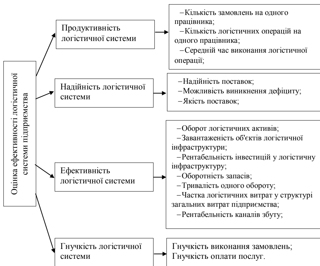
Рис. 1. Показники оцінки логістичної системи підприємства

Частина таких показників (індивідуальні) відображає окремі складники ефективності логістичної діяльності, а інша частина (загальні) характеризує розвиток логістичної системи загалом. Загальні й індивідуальні показники оцінки ефективності логістичної діяльності підприємства нами узагальнені та наведені на рис. 2.