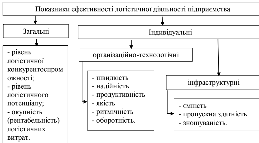
Рис. 2. Показники оцінки ефективності логістичної діяльності підприємства