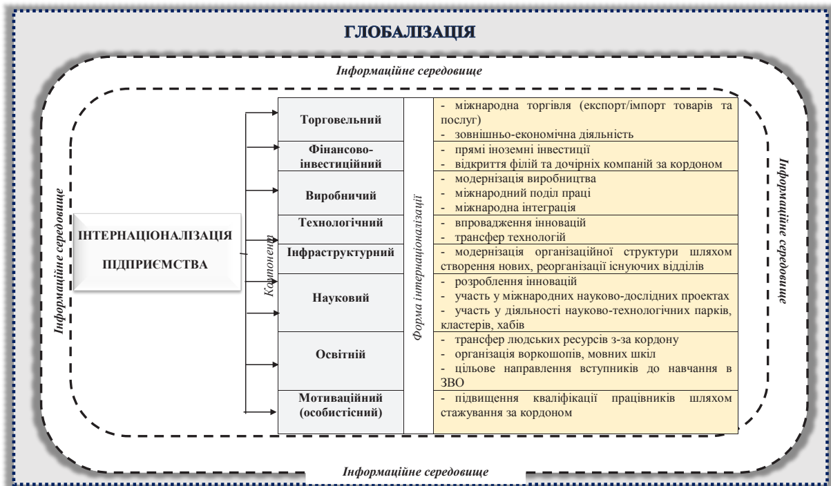
Рис. 2. Ієрархічна модель форм інтернаціоналізації підприємства