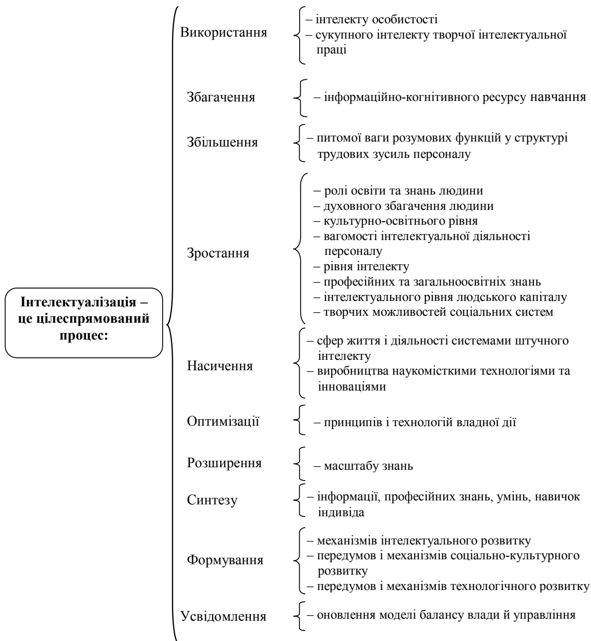
Рис. 2. Багатоаспектний розгляд інтелектуалізації