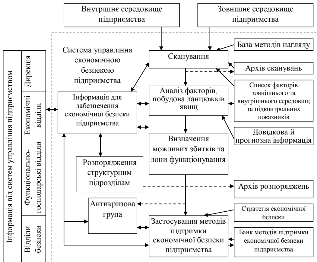
Рис. 2. Схема управління інформацією в системі забезпечення економічної безпеки підприємства