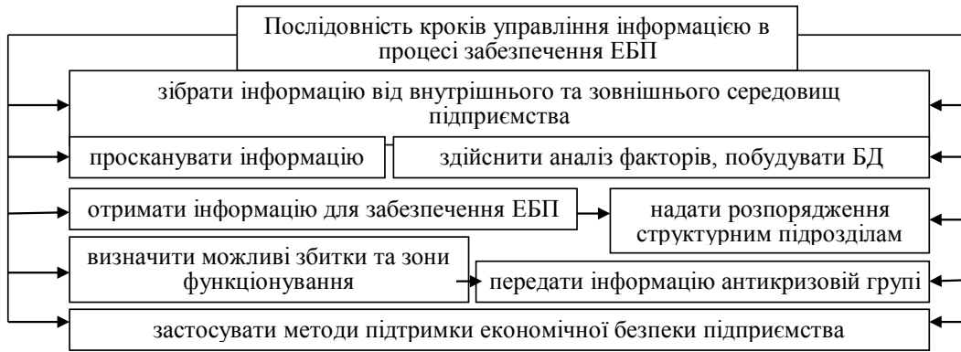
Рис. 1. Послідовність кроків управління інформацією в процесі забезпечення ЕБП