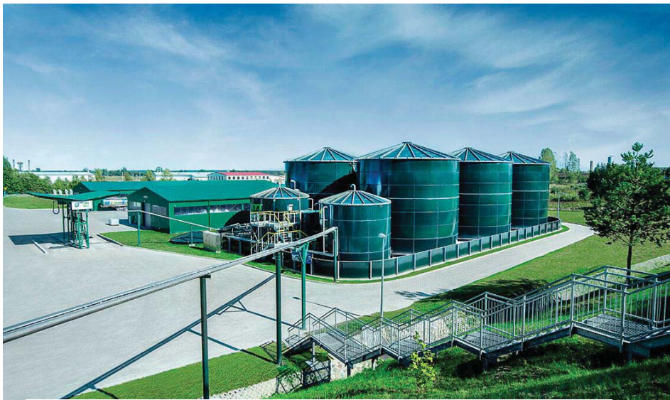
Рис. 1. Загальний вигляд бази для зберігання рідких мінеральних добрив / Fig. 1. General view of the base for storage of liquid mineral fertilizers

добрив, постає питання реконструкції існуючих складів РМД [1].