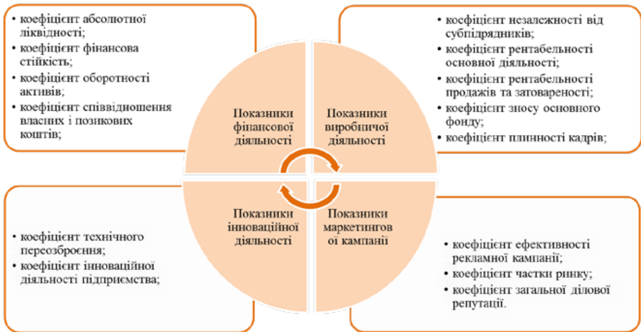
Рис. 3. Система показників оцінки конкурентоспроможності підприємства