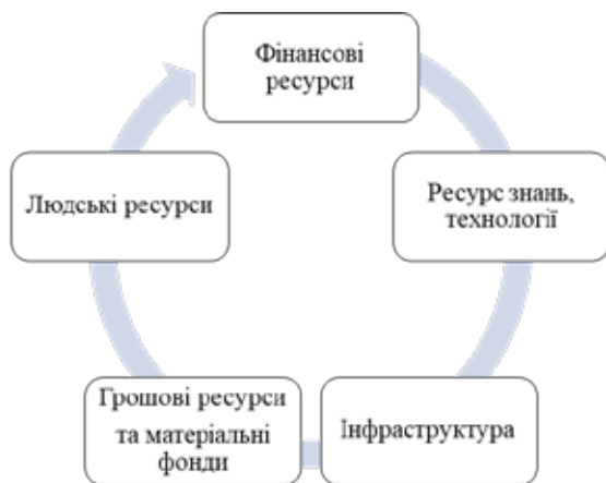
Рис. 2. Фактори виробництва підприємства М. Портера