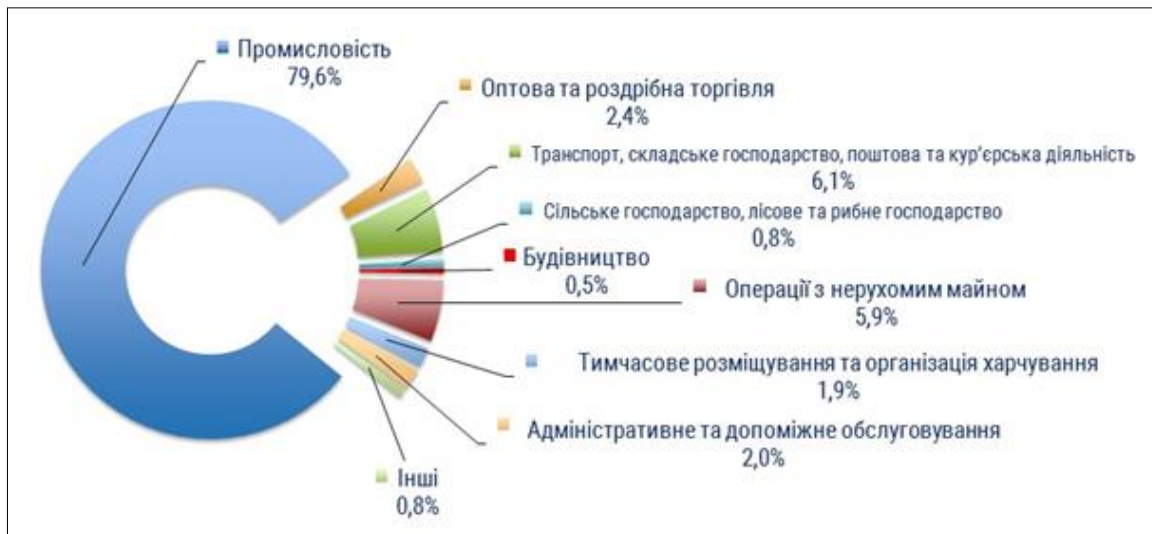
Рис. 4. Структура залучення іноземних інвестицій у Закарпатську область за видами економічної діяльності на 01.07.2019

діяльності, інвестиційні паспорти об'єднаних територіальних громад та стратегії їхнього розвитку.