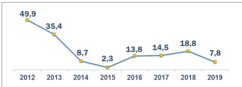
Рис. 2. Динаміка залучення прямих іноземних інвестицій у Закарпатську область у першому півріччі 2012–2019 рр., млн дол. США