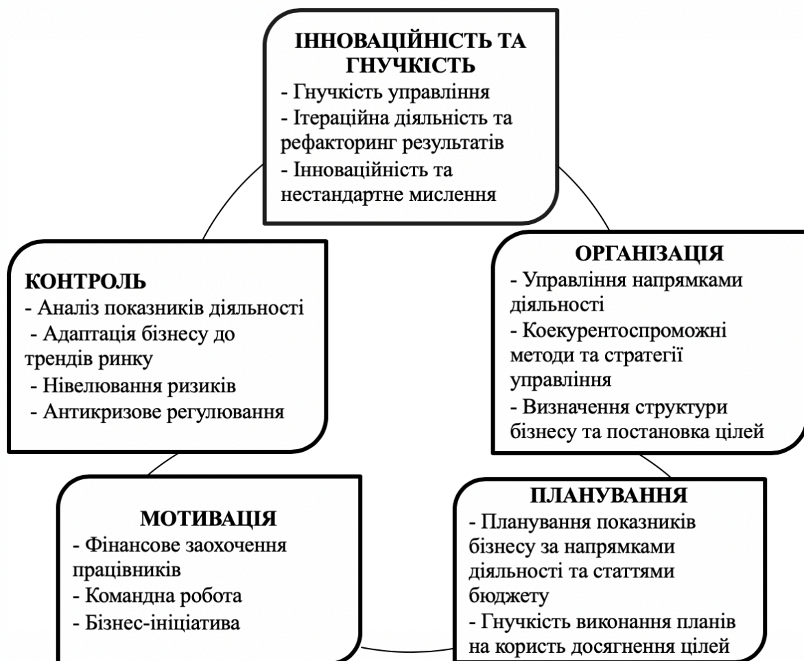
Рис. 2 Зв'язок основних функцій управління підприємницькою діяльністю

• Функції управління середньої ланки – це сукупність функцій планування, організації, мотивації, контролю, інноваційного та гнучкого розвитку, які здійснюються за напрямками діяльності суб'єкта підприємницької діяльності. Вважаємо за доцільне власне в рамках цієї групи виділяти такі галузеві функції: управління виробництвом продукції та послуг, управління допоміжними виробничими ресурсами, управління торгівлею, управління персоналом, бюджетування, управління запасами та ремонтами, управління ІТ, управління науково технічним прогресом, управління іншими витратами тощо.