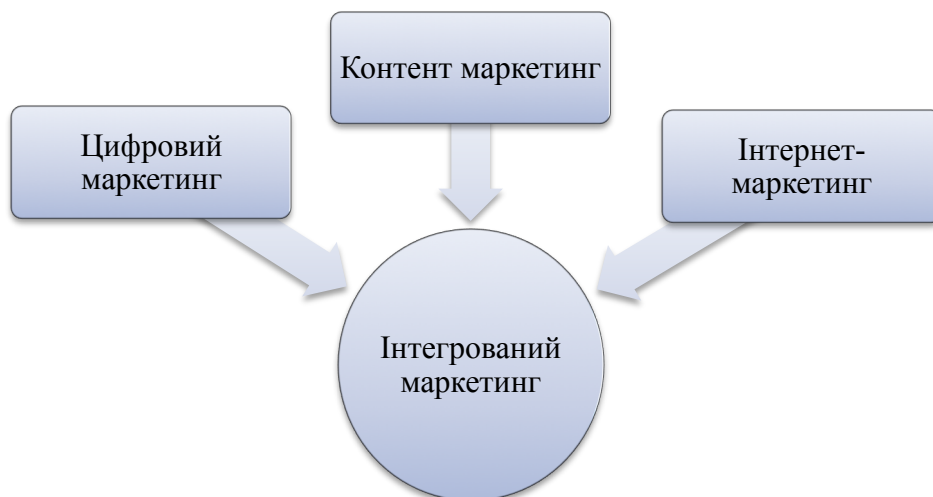
Рис. 1 Схема взаємозв'язку сучасних концепцій маркетингу

Узагальнене відображення вище зазначених концепцій можна зобразити у вигляді схеми (рис. 1).